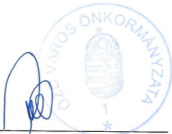
Janiczak Dávid polgármester Ózd Város Önkormányzata Megrendelő